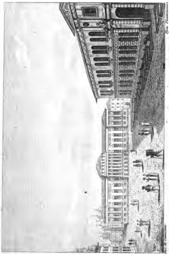
Главный вход в здание штата Теннесси в Нэшвиле.